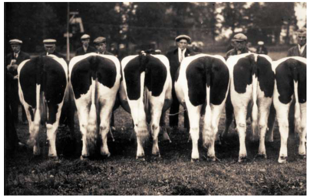
Ruinerwoldse deelname aan de veekeuring de Wijk 1935

ten we niet, want naderhand werd de veestapel herhaaldelijk door mond-en-klauwzeer en andere veenziekten zodanig geteisterd, dat men zwartbont vee uit Jutland en Sleeswijk Holstein heeft ingevoerd, waarmee men verder doorfokte, met een bewust type voor ogen. Dit is in Zuidwest Drenthe met name in Ruinerwold en de Wijk zo succesvol geweest, dat de fokkerijen daar wereldvermaardheid hebben verkregen.