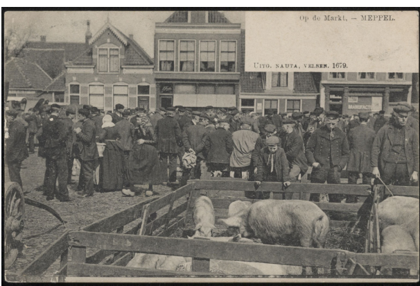
de varkenmarkt van Meppel

Er zijn wel meer perioden geweest waarin de biggen niets tot bijna niets opbrachten. Sommige boeren stopten toen na het aflopen van de markt hun niet verkochte biggen in de brikke van een ander met als gevolg dat ze deze biggen dan ook niet meer hoefden voeren.